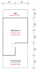
แผนที่โครงการที่มีพื้นที่ 133/2