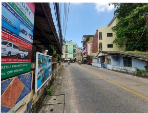
สภาพถนนนาใน (ถนนสายหลัก) (จุดถ่ายภาพที่ 1)

" ทรัพย์สินที่บสอ.อยู่ระหว่างริบโอนกรรมสิทธิ์ บสอ. ขอสงวนสิทธิ์ในการเปลี่ยนแปลงเงื่อนไขข้อมูลทรัพย์สิน โดยไม่ต้องแจ้งให้ทราบล่วงหน้า "