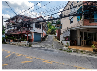
สภาพซอยไม่มีชื่อ (ถนนเข้าสู่ทรัพย์สิน) (จุดถ่ายภาพที่ 2)