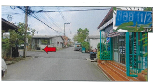
สถานที่ตั้งทรัพย์สิน