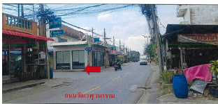
สถานที่ตั้งทรัพย์สิน