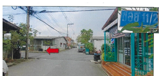
ภาพถ่ายหน้าอาคารพาณิชย์ซอยวัดพุนาราม 16