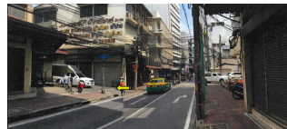
จุดถ่ายภาพ 1 : ทางเข้า ซอยที่ 11 ซอยบางขุนพรหม - ถนนอนุวงศ์ แขวงจันทรเกษม