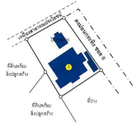
■ ทรัพย์สินที่ประเมินมูลค่า : สิ่งปลูกสร้าง จำนวน 2 รายการ ● บ้านพักอาศัยที่ประเมินมูลค่า 94/12 หมู่ 6