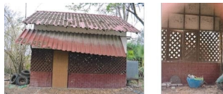
ทรัพย์สินที่ประเมินมูลค่า สิ่งปลูกสร้างรายการที่ 6