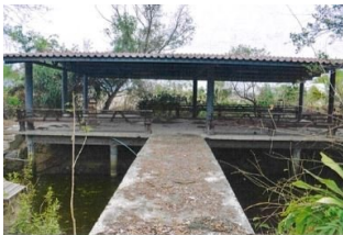
ทรัพย์สินที่ประเมินมูลค่า สิ่งปลูกสร้างรายการที่ 5