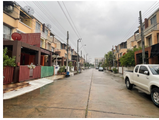
THE CUBE บางนาตราด-สุขุมวิท