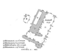
ผังอพาร์ทเมนท์ 1208 ชั้น 12 ซึ่งตั้งอยู่ภายในอาคารพาณิชย์ 12 ชั้น 1208 ถนนสุขุมวิท กรุงเทพมหานคร