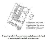
ผังอาคาร 129/2 (ห้อง 102) ซึ่งสามารถดูรายละเอียดได้ที่ลิงก์ด้านล่าง