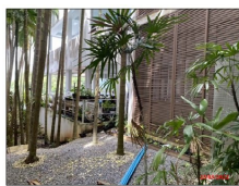
ภาพภายในห้องเลขที่ 129/2 (ห้อง 102) ชั้น 1 ซึ่งอยู่ตรงกลางอาคาร 2 ชั้น อาคารเลขที่ 1 ใน 0