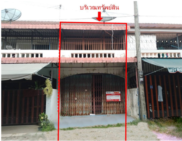
บริเวณทรัพย์สิน