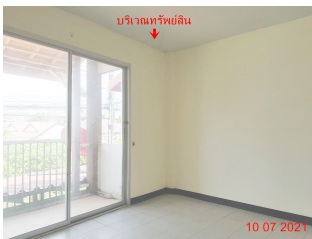
บริเวณทรัพย์สิน