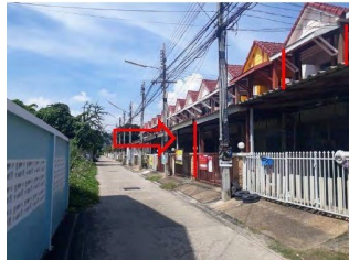
ภาพถนนผ่านหน้าทรัพย์สินที่ประเมิน (จุดถ่ายภาพ B)