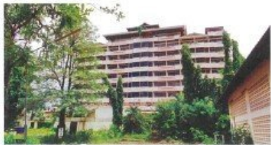
สภาพ และรูปทรง อาคาร โรงแรมสูง 10 ชั้น (รายการที่ 1) ก่อสร้างอยู่ภายในที่ดินทรัพย์สิน กลุ่มที่ 1