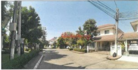
สภาพทั่วไปหมู่บ้านแฟมอร์เพลท พาร์ค พระราม 5-บางใหญ่ ซอย 21 บริเวณถนนผ่านหน้าที่ตั้งทรัพย์สิน (จุดถ่ายภาพที่ 5)