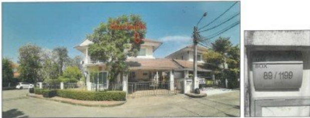
สภาพทั่วไปหมู่บ้าน ซอย 21 บริเวณด้านหน้าที่ตั้งทรัพย์สิน เลขที่ 89/1199 (จุดถ่ายภาพที่ 6)