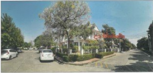
สภาพทั่วไปหมู่บ้านแฟมอร์เพลท พาร์ค พระราม 5-บางใหญ่ ซอย 21 บริเวณถนนผ่านหน้าที่ตั้งทรัพย์สิน (จุดถ่ายภาพที่ 4)