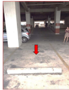
ห้องรถ หมายเลข 228 บริเวณหน่วย 155180 ชั้นที่ 22