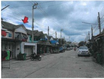
5. สภาพโดยทั่วไปบริเวณถนนผ่านหน้าทรัพย์สินที่ประเมินมูลค่า/ บริเวณถนนเมนในหมู่บ้านอิมพีเรียล เทคส์ ที่จังหวัดศรีสะเกษ