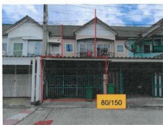
6. สภาพโดยทั่วไปบริเวณด้านหน้าทรัพย์สินที่ประเมินมูลค่าทาวนเฮ้าส์ 2 ชั้น เลขที่ 80/150 จำนวน 1 คูหา