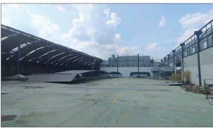
สภาพหลังคาของโรงงาน