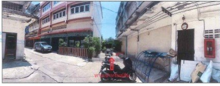
สภาพของไม่มีชื่อ บริเวณผ่านหน้าที่ตั้งทรัพย์สินที่ประเมินมูลค่า (จุดถ่ายภาพที่ 3)