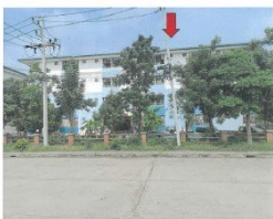
อาคารชุดตึกสิรินนคร คอนโดมิเนียม อาคารเลขที่ 97 (อาคารซี) อาคารที่ตั้งทรัพย์สิน