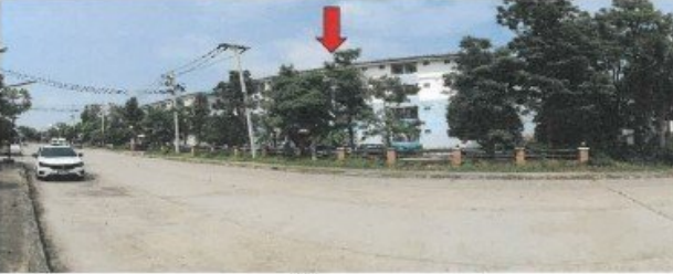
ถนนโครงการตึกสิรินนคร / ผ่านหน้าอาคารเลขที่ 97 (อาคารซี) อาคารที่ตั้งทรัพย์สิน(จุดถ่ายภาพที่ 5)