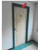
สภาพด้านหลังห้องเลขที่ 97/9 (C117) ชั้นที่ทรัพย์สิน