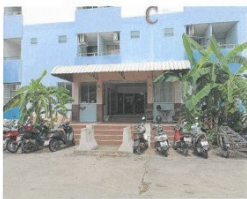
อาคารชุดตึกสิรินนคร คอนโดมิเนียม อาคารเลขที่ 97 (อาคารซี) อาคารที่ตั้งทรัพย์สิน