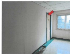
สภาพด้านหน้าห้องเลขที่ 97/9 (C117) ชั้นที่ทรัพย์สิน