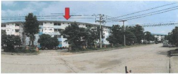
ถนนโครงการตึกสิรินนคร / ผ่านหน้าอาคารเลขที่ 97 (อาคารซี) อาคารที่ตั้งทรัพย์สิน(จุดถ่ายภาพที่ 4)