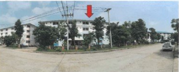
ถนนโครงการตึกสิรินนคร / อาคารเลขที่ 97 (อาคารซี) อาคารผ่านหน้าที่ตั้งทรัพย์สิน(จุดถ่ายภาพที่ 6)