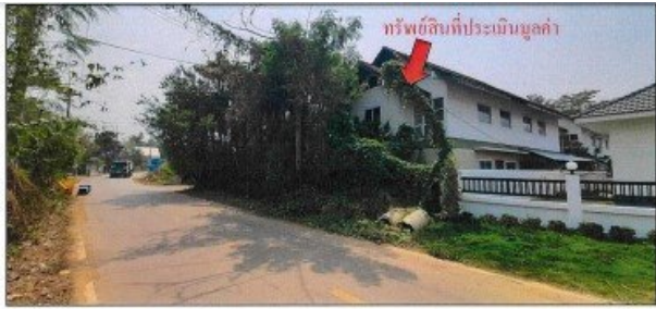
สภาพถนนผ่านหน้าทรัพย์สินที่ประเมินมูลค่า (จุดถ่ายภาพที่ 4)