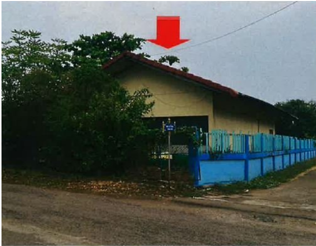
รายการที่ 2 : อาคารตึกชั้นเดียว