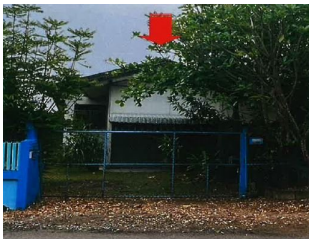
รายการที่ 1 : บ้านพักอาศัยชั้นเดียว เลขที่ 167/3