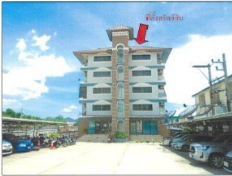
ภาพถ่ายอาคารชุด ถนนวิภาวดีรังสิต แขวงจตุจักร เขตจตุจักร กรุงเทพมหานคร ที่ตั้งทรัพย์สินที่ประเมินมูลค่า ห้องชุดเลขที่ 89/105 (505) และ 89/106 (506) ชั้นที่ 5 (จุดถ่ายภาพที่ 3)