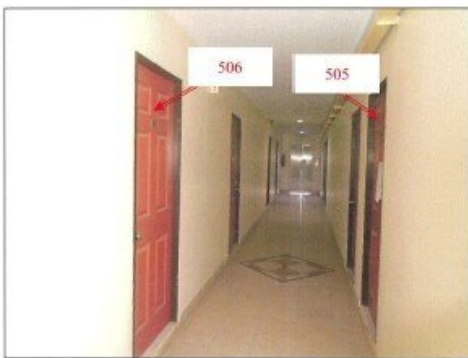
ภาพถ่ายทางเดินหน้าห้องชุดทรัพย์สินที่ประเมินมูลค่า ( จุดถ่ายภาพที่ 4 )