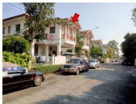
5 ภาพถ่ายจากเว็บไซต์ของธนาคารอิสลามแห่งประเทศไทย