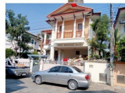
6 ภาพถ่ายจากเว็บไซต์ของธนาคารอิสลามแห่งประเทศไทย