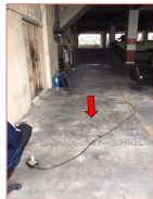
ห้องเช่า ชั้น 22 บริเวณชั้นที่ 19/351 ชั้นที่ 22