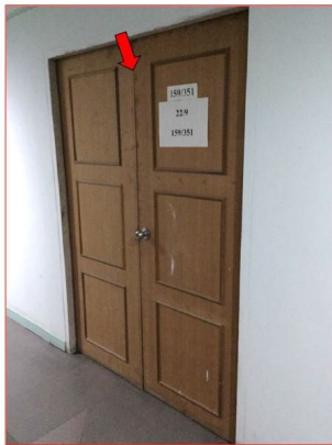
สภาพหน้าห้องชุดทรัพย์สิน ห้องเลขที่ 159/351 ชั้นที่ 22