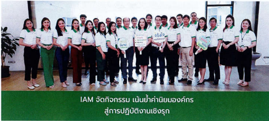
IAM จัดกิจกรรม เน้นย้ำค่านิยมองค์กร สู่การปฏิบัติงานเชิงรุก