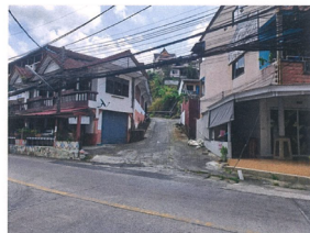
สภาพซอยไม่มีชื่อ (ถนนเข้าสู่ทรัพย์สิน) (จุดถ่ายภาพที่ 2)