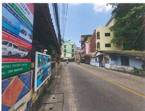
สภาพถนนหน้า (ถนนสายหลัก) (จุดถ่ายภาพที่ 1)