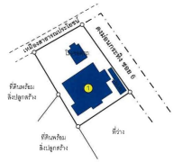
■ พื้นที่ซึ่งประเมินมูลค่า : สิ่งปลูกสร้าง จำนวน 2 รายการ ● บ้านพักอาศัยที่ประเมินมูลค่าที่ 04/12 หมู่ 6