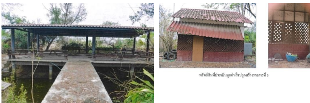
ทรัพย์สินที่ประเมินมูลค่า ตั้งอยู่ระหว่างอาคารที่ 5