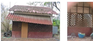
ทรัพย์สินที่ประเมินมูลค่า ตั้งอยู่เลขที่ ๖ อาคารที่ ๖