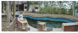
ทรัพย์สินที่ประเมินมูลค่าที่ 7 กลุ่มกองทุนหมู่บ้าน