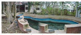
ทรัพย์สินที่ประเมินมูลค่า ตั้งอยู่เลขที่ ๑ อาคารที่ ๑