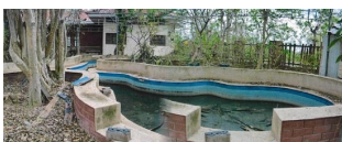
ทรัพย์สินที่ประเมินมูลค่า ตั้งอยู่ระหว่างอาคารที่ 7