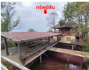
ทรัพย์สินที่ประเมินมูลค่า ตั้งอยู่เลขที่ ๑ อาคารที่ ๑