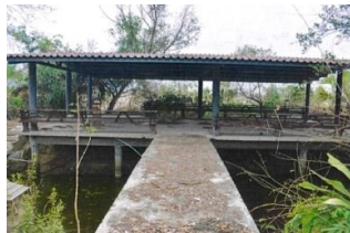
ทรัพย์สินที่ประเมินมูลค่า ที่ 5 กลุ่มกองทุนหมู่บ้าน