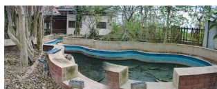
ทรัพย์สินที่ประเมินมูลค่า ตั้งอยู่ระหว่างอาคารที่ 7