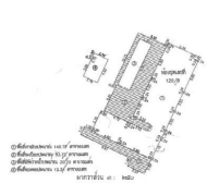
ห้องชุดที่ 1208 ชั้น 12 ชั้น 402 ชั้น 4 ชั้น 403 ห้องประชุม และครัวพร้อม/ ภูเก็ต อพาร์ทเมนท์ 1 โยนิ ขนาดพื้นที่ห้องชุดที่ 2,283.00 ตารางเมตร 245.00 ตารางเมตร