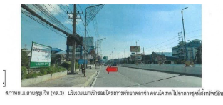
ภาพถนนสายสุขุมวิท (ทล.3) บริเวณแยกข้ามโรงเรียนโครงการพัฒนาฯ คอนโดมีเขต ไม่สามารถจอดรถที่จอดรถอื่น