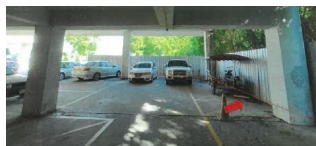
ภาพของโครงการพัฒนาฯ คอนโดมีเขต ผ่านมือที่เพิ่งเสร็จสิ้น