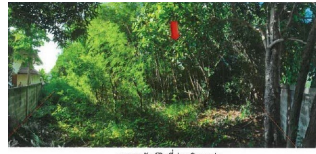
สภาพทรัพย์สินที่ประเมินมูลค่า