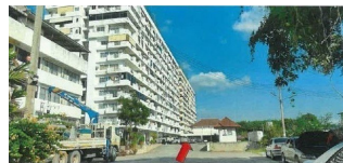
ภาพของโครงการที่พักอาศัยฯฯ คอนโดมีเดีย โมเดิร์นไลฟ์โฮมโฮม