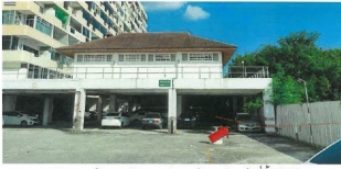
สภาพของโครงการพักอาศัยอาคาร คอนโดมิเนียม ผ่านหน้าที่ตั้งทรัพย์สิน