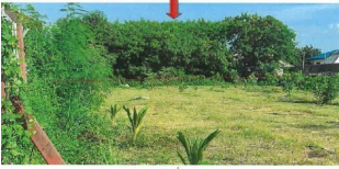
สภาพทรัพย์สินที่ประเมินมูลค่า