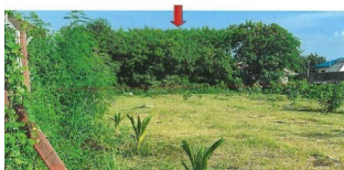
ภาพทรัพย์สินฝั่งตะวันออก