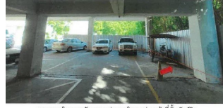
สภาพของโครงการพักอาศัยอาคาร คอนโดมิเนียม ผ่านหน้าที่ตั้งทรัพย์สิน