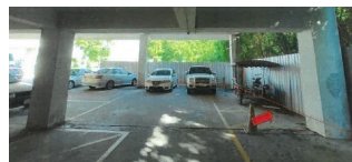
ภาพของโครงการที่พักอาศัย คอนโดมิเนียม ผ่านบันไดที่พักรีสตาร์ท