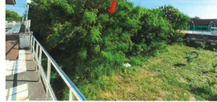
ภาพทรัพย์สินฝั่งประมงสุทัศน์