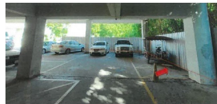
ภาพของโครงการที่พักอาศัยฯฯ คอนโดมีเดีย ผ่านบันไดที่ฝั่งทรัพย์สิน