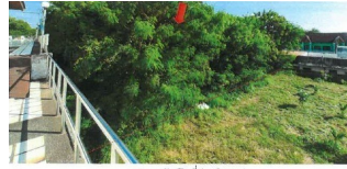
สภาพทรัพย์สินที่ประเมินมูลค่า