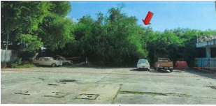
สภาพทรัพย์สินที่ประเมินมูลค่า