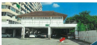
ภาพของโครงการพัฒนาฯ คอนโดมีเขต ผ่านมือที่เพิ่งเสร็จสิ้น