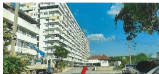
ภาพของโครงการพัฒนาฯ คอนโดมีเขต ไม่สามารถจอดรถอื่น