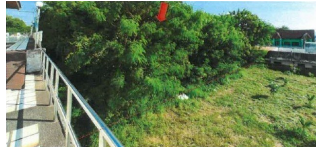
สภาพทรัพย์สินเป็นป่าเบญจพรรณ