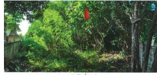
สภาพทรัพย์สินที่ประเมินมูลค่า