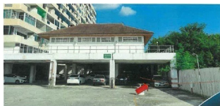
ภาพของโครงการที่พักอาศัยฯฯ คอนโดมีเดีย ผ่านบันไดที่ฝั่งทรัพย์สิน