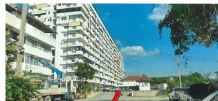
ภาพของโครงการที่พักอาศัย คอนโดมิเนียม โมเดิร์นที่พักรีสตาร์ท