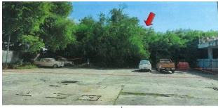
สภาพทรัพย์สินที่ประเมินมูลค่า