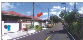
จุดถ่ายภาพที่ 5,6 / สภาพของบัตร 3 และ 10 ด้านหน้าใต้พylon