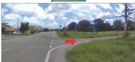
จุดถ่ายภาพที่ 1,2 / สภาพถนนสาธารณะ และสภาพของตู้จำหน่ายบัตร 1 โถงใต้พylon