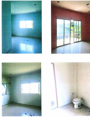
สภาพภายในอาคาร พร้อมสิ่งอำนวยความสะดวก