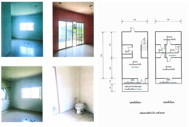
สภาพภายในอาคาร พร้อมสิ่งอำนวยความสะดวก