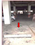
ที่จอดรถ ชั้น 22 บริเวณลิฟต์ที่ 1 และ 2