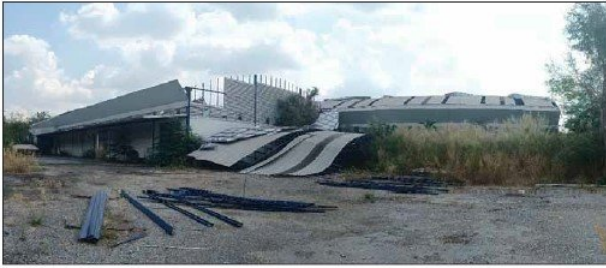
อาคาร โรงงาน (อาคาร 1)