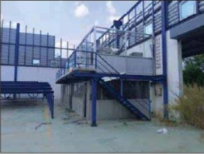
สภาพสำนักงานภายใน โรงงาน