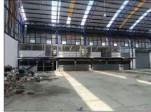
สภาพสำนักงานภายใน โรงงาน