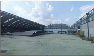
สภาพภายในอาคาร โรงงาน