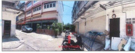
สภาพของไม้มีชื่อ บริเวณผ่านหน้าที่ตั้งทรัพย์สินที่ประเมินมูลค่า (จุดถ่ายภาพที่ 3)