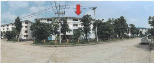
ถนนโครงการดักสิรานคร / อาคารเลขที่ 97 (อาคารซี) อาคารผ่านหน้าที่ตั้งทรัพย์สิน(จุดถ่ายภาพที่ 6)