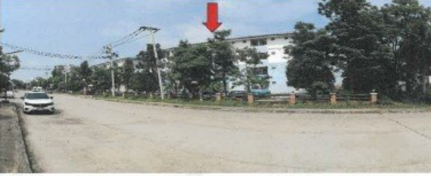
ถนนโครงการดักสิรานคร / ผ่านหน้าอาคารเลขที่ 97 (อาคารซี) อาคารที่ตั้งทรัพย์สิน(จุดถ่ายภาพที่ 5)