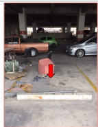
ที่จอดรถ ชั้นที่ 200 มีอยู่หน่วยที่ 199/200 ชั้นที่ 22